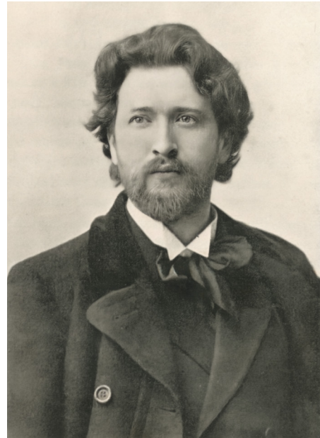
Ferruccio Busoni, Dresden 1897

Der schöpferische Prozess gestaltete sich jedoch zäh und dauerte etwa eineinhalb Jahrzehnte, ohne das Werk vollständig abschließen zu können. 8 Das Libretto zum Doktor Faust hatte Busoni in wenigen Tagen noch in Berlin niedergeschrieben, bevor er Anfang 1915 kriegsbedingt Europa verlassen musste und eine längere Konzertreise durch die Vereinigten Staaten antrat. Die ersten Takte und einige Vorstudien zu Faust -Szenarien stammen bereits aus dem Jahr 1910, als Busoni andere Kompositionen niederschrieb (z.B. Nocturne Symphonique , KinBu 262, Sonatina Seconda , KinBu 259). 9 Eigenentlehnungen, sowohl in seinen kompositorischen als auch schriftstellerischen Werken, gehörten zu Busonis Praxis. Häufig verwendete er musikalische Werkteile oder griff auf Früheres zurück, das er entweder durch Hinzufügen neuer Passagen anreicherte oder neu veröffentlichte oder unter einem neuen Titel wiederveröffentlichte. Antony Beaumont konnte nachweisen, dass Busoni aus 23 seiner eigenen Kompositionen Entlehnungen für seine Oper Doktor Faust entnahm. 10 So ließ Busoni beispielsweise die Orchesterstücke Sarabande und Cortège (KinBu 282) als Symphonisches Intermezzo in die Faust -Oper