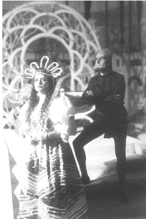
Szene aus Doktor Faust , Dresden 1925

III. Bild (Universität Wittenberg, Fausts Reinkarnation)