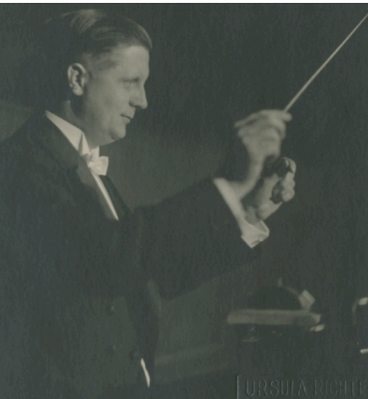
Fritz Busch dirigiert in Dresden, 1926

einfließen. Die Reinschrift der Partitur erfolgte zwischen Juli 1917 und Mai 1923. 11 Zweifel und Ehrfurcht hielten ihn immer wieder von der kontinuierlichen Fortsetzung der übermächtigen Aufgabe zurück.