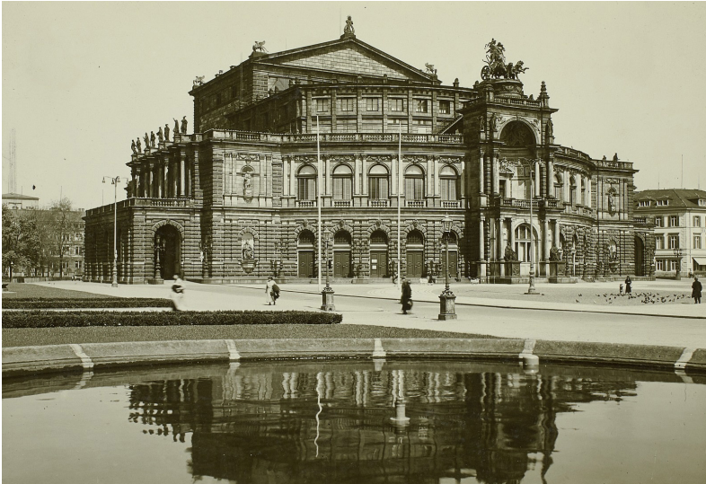
Semperoper, ca. 1930

In diesem Jahr widmete sich die Klassik-Stiftung Weimar in dem Themenjahr Faust2025 dem großen Werk, das Johann Wolfgang von Goethe sein Leben lang beschäftigte. Mit einem breiten Spektrum an Veranstaltungen entstand ein Faust-Lab, in dem die Besucherinnen und Besucher der Frage nach der Relevanz und Aktualität des Werkes nachgehen können.